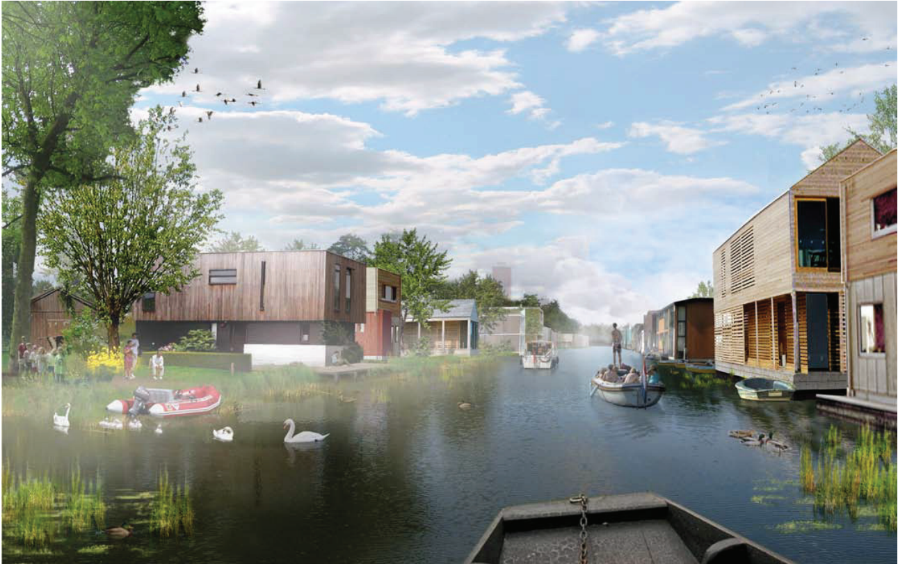
Waterway in Almere connecting people's backyards to the city centre. Design by Mecanoo and West 8

en kostenbesparingen (latente kapitaalbron) die voortvloeien uit de projecten.